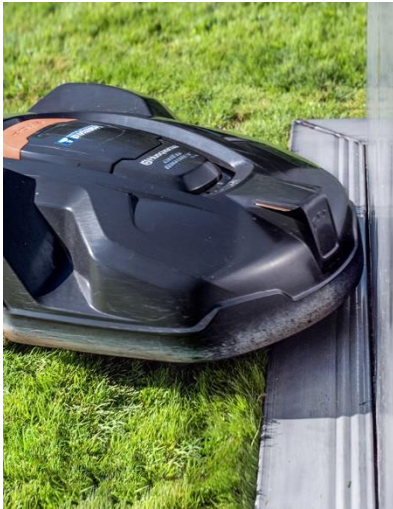
Mähkante mit Mähroboter